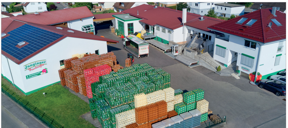
Offen für neueste Technik: die Jungingers Produktionsstätte in Niederstotzingen.

Von THOMAS LEHMANN, Geschäftsführer BMS Maschinenfabrik GmbH