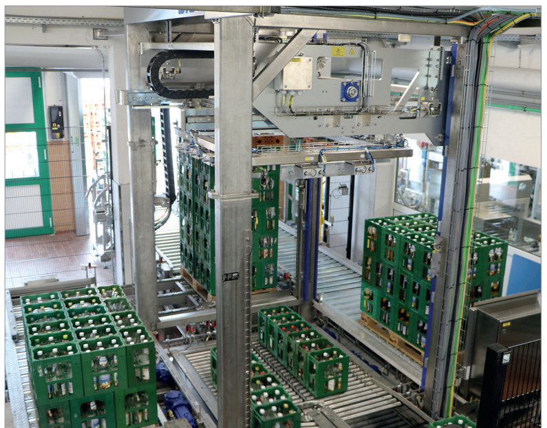
Der Palettierer transportiert die Leerpaletten (v.l.) bedarfsgerecht von der Entlade- auf die Beladeseite. Ein zusätzlicher Palettentransport ist nicht erforderlich.

te in vier eigenen Getränkemärkten. Als weitere Vertriebschienen bedient Junginger mit seinem Fuhrpark befreundete Brauereien, die